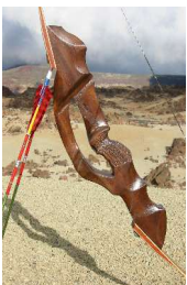
Detailansichten vom Griff und Schussfenster